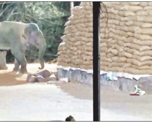
आशंका। हाथी के उत्पात के बाद मंडी प्रबंधन और स्थानीय किसानों ने दहशत का माहौल व्याप्त है। हाथी द्वारा बिखराए धान से भरी बोरियां अस्त व्यस्त पड़ी हुई हैं जिससे किसानों की मेहनत पर संकट के बादल छा गए हैं। घटना के बाद वन विभाग ने तत्परता दिखाते हुए अलर्ट जारी कर दिया है और रात के समय मंडी की ओर जाने पर रोक लगा दी गई है। बावजूद इसके सबसे बड़ा खतरा यह खड़ा हो रहा है कि इतनी बड़ी मात्रा में खुले में रखे 30 हजार

रायगढ़। जिले के कुड़केला स्थित धान मंडी में बीती रात उस समय हड़कंप मच गया, जब अचानक एक जंगली हाथी मंडी परिसर में घुस आया। हाथी ने मंडी में जमकर उत्पात मचाते हुए धान से भरी बोरियों को बेरहमी से इधर उधर पटक दिया, जिससे हजारों क्विंटल धान को नुकसान पहुंचने की आशंका गहरा गई है। प्रत्यक्षदर्शियों के अनुसार, हाथी के अचानक प्रवेश से मंडी परिसर में अफरा तफरी का माहौल बन गया। मंडी में कार्यरत कर्मचारियों ने किसी तरह अपनी जान बचाकर भागने में ही भलाई समझी।