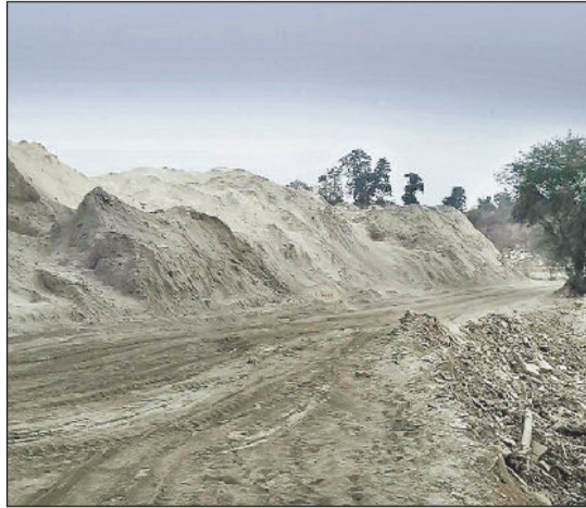
खनन परिया और उसमें डंप कचरा।

सारंगढ़ बिलासपुर जिले के ब्लॉक मुख्यालय बिलासपुर अंतर्गत दुमहानी और बिलासपुर मुख्य मार्ग से महज 100 मीटर की दूरी में छपोरा के पत्थर खदानों में प्रतिदिन सैकड़ों ट्रकों के माध्यम से डाला जा रहा है। फ्लाईऐश औद्योगिक कचरा डंपिंग जिससे फैल रहा औद्योगिक जहर अब केवल पर्यावरणीय संकट नहीं, बल्कि प्रशासनिक चूक और निगरानी तंत्र की विफलता का गंभीर उदाहरण बनता जा रहा है। रायगढ़ जिले के औद्योगिक संयंत्रों से निकलने वाला फ्लाईऐश एवं औद्योगिक कचरा खुलेआम जल स्रोत युक्त पत्थर खदानों में डंप किया जा रहा है, लेकिन अब तक किसी भी जिम्मेदार विभाग ने कार्रवाई नहीं की है। प्राप्त जानकारी के अनुसार प्रतिदिन 300 से अधिक भारी मालवाहक वाहन रायगढ़ से सारंगढ़, सरसीवां, भटगांव होते हुए बिलासपुर क्षेत्र में प्रवेश कर रहे हैं। ये वाहन पूरे रास्ते सड़कों पर फ्लाईऐश गिराते हुए चलते हैं, जिससे सड़कें सफेद परत में तब्दील हो चुकी