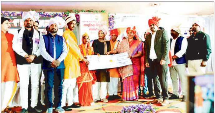
सीएम विष्णुदेव साय ने राजधानी से वर्चुअली नवदंपतियों को दिया आशीर्वाद

मुख्यमंत्री कन्या विवाह योजना के अंतर्गत जिला प्रशासन एवं महिला एवं बाल विकास विभाग के संयुक्त तत्वावधान में जशपुर जिले के वरिष्ठ कम्युनिटी हॉल, जशपुर में सामूहिक कन्या विवाह समारोह का आयोजन किया गया। जिला स्तरीय इस कार्यक्रम में जिले के 48 जोड़े वैदिक रीति-रिवाजों एवं धार्मिक अनुष्ठानों के साथ परिणय सूत्र में बंधकर दाम्पत्य जीवन की शुरुआत की। विवाह उपरांत सभी नवदंपतियों को विवाह प्रमाण पत्र प्रदान किया गया तथा शासन की मुख्यमंत्री कन्या विवाह योजना के अंतर्गत कन्या के नाम से 35-35 हजार रुपये का चेक एवं उपहार सामग्री प्रदान की गई। कार्यक्रम में नवविवाहित जोड़ों के परिजनों ने भी उत्साहपूर्वक सहभागिता