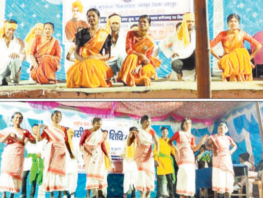
आसपास स्वच्छता अभियान तथा नशा मुक्ति संबंधी नारालेखन का कार्य किया गया। इन गतिविधियों के माध्यम से ग्रामीणों को स्वच्छता एवं नशामुक्ति के प्रति जागरूक किया गया। दोपहर में आयोजित बौद्धिक परिचर्चा में कार्यक्रम की मुख्य

जशपुरनगर। शासकीय राम भजन राय स्नातकोत्तर महाविद्यालय, जशपुर की राष्ट्रीय सेवा योजना इकाई द्वारा सा त दि व सी य वि शे ष शिविर का आयोजन 7 फरवरी से 13 फरवरी तक ग्राम भुडकेला में किया जा रहा है। शिविर के अंतर्गत स्वयंसेवकों द्वारा सामाजिक चेतना एवं जनकल्याण से जुड़ी विविध गतिविधियां निरंतर उत्साहपूर्वक संचालित की जा रही हैं। शिविर के चौथे दिवस स्वयंसेवकों द्वारा श्रम कार्य एवं श्रम परियोजना कार्य के अंतर्गत ग्राम के चर्चपारा स्थित हैंडपंप के पास साफ-सफाई, सोखात गड्ढा निर्माण, पुलिया के