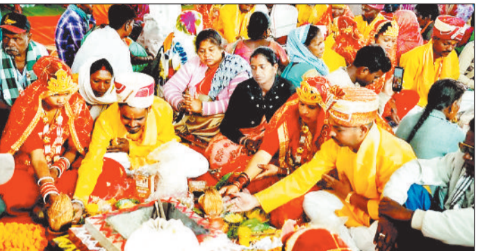
संस्कारों से दोनों कुलों को संवारती हैं और परिवार में सुख-समृद्धि लाती हैं। महिला जीवन में प्रवेश कर रहे हैं, जो समाज में सामूहिक सौहार्द और समरसता का संदेश देता है। उन्होंने कहा कि बेटियां अपने

जिले में कुल 48 जोड़ों का विवाह संपन्न हुआ, जिनमें एक दिव्यांग जोड़ा भी शामिल है।